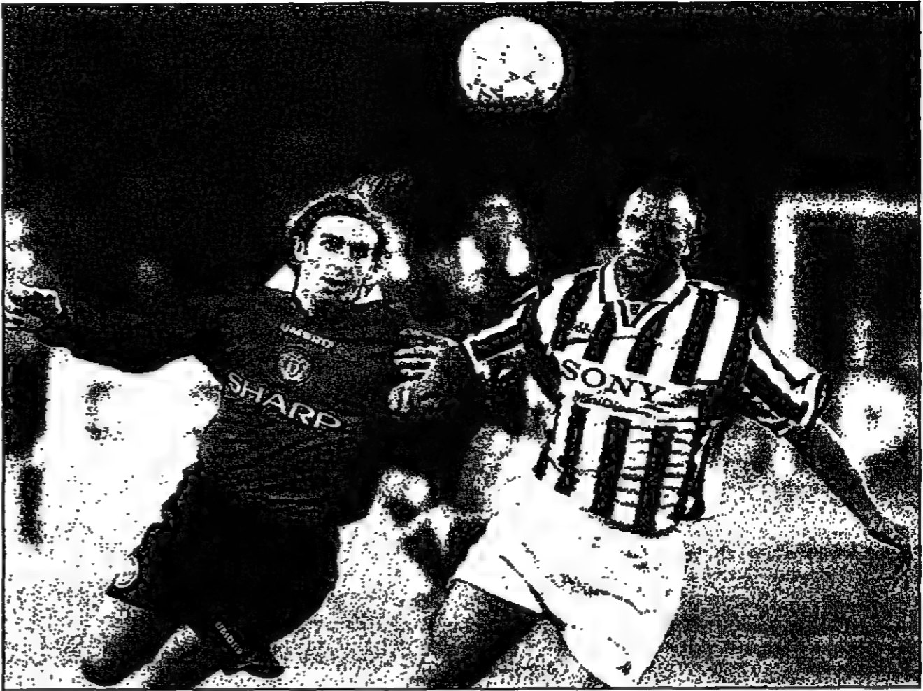
لقطة من مباراة مانشستر يونايتد مع يوفنتوس في بداية المباراة